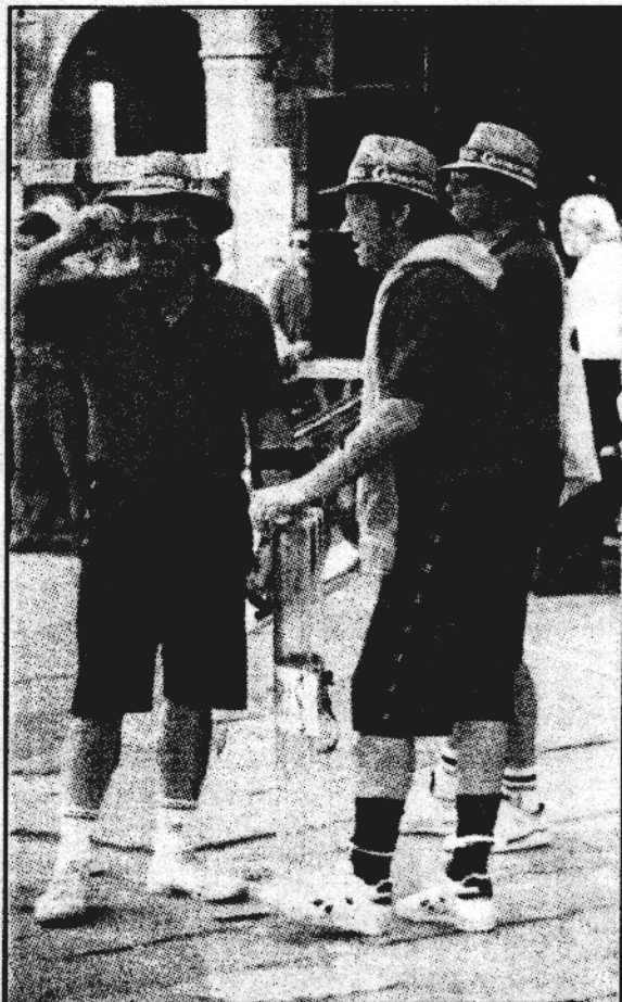
Ščitnike za varstvo gledalcev pred nevarnim lesnim pandolom je za turnir zagotovila koprška policijska postaja

Sicer obstajata dve različni tolmačenji, zakaj je pandolo propadel. Po eni so za to krivi avtomobili, ki so preplavili mestne trge in z njih igralce. Po drugi razlagi pa so za to krivi sesalniki za prah in metle s plastičnimi ročaji, ki so zamenjali klasično sirskovo metlo s trdim lesnim ro-