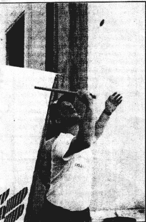
na serva — pandolo mora v zrak in preiti vsaj višino serviserja

na ulice, kakor pravijo eni, Izrinili injski prlpomočki, ki so na